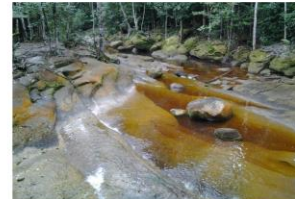
Figura 01. Córrego Santuário, Município de Presidente Figueiredo (AM).