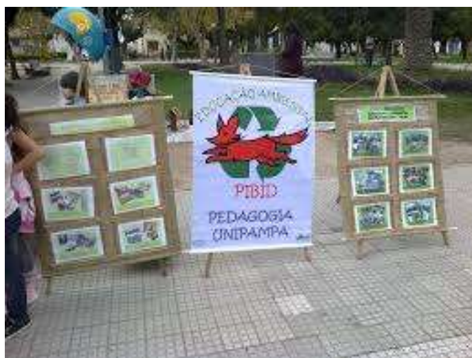
Figuras 1 e 2 – Banner confeccionado com papel madeira, que poderá ser feito em esteira ou papelão.