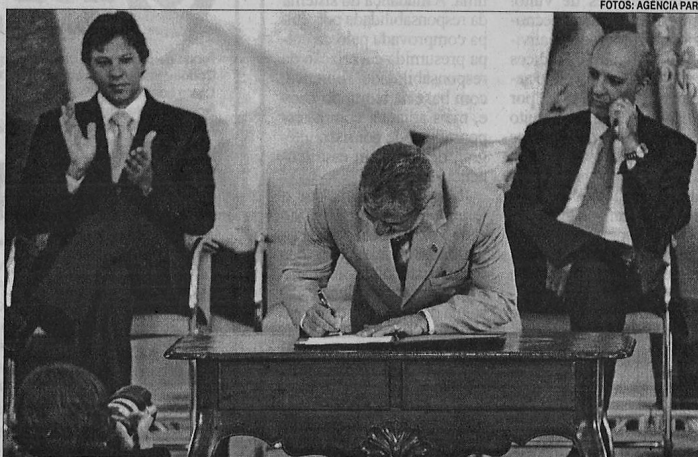
O presidente Luiz Inácio Lula da Silva assina o decreto de criação da Universidade