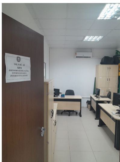
Figura 2. Sala de funcionamento da ARNI (bloco modular Tapajós).

setor. A sala comporta pequenas reuniões (2 a 3 pessoas no máximo), em reuniões com maior número de envolvidos, recorre-se as salas de reuniões disponíveis para este fim (432, 447, 420, 345B). A Infraestrutura digital ainda requer melhorias, dado que a impressora do setor encontra-se quebrada e softwares importantes para análise e construção de documentos (pacote Microsoft Office) não estão instalados nos computadores institucionais do setor, o que acarreta mais demora nas análises de processos do que deveria.