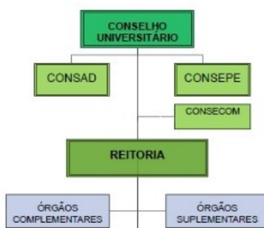
Figura 1. Organograma onde está inserida a ARNI no âmbito da UFOPA (Órgão complementar-Reitoria).

A ARNI é um órgão complementar ligado a Reitoria, não possui coordenações e nem diretorias, tão somente o Assessor e seus demais servidores. O organograma da Arni (figura 1) está disponível em: https://www.ufopa.edu.br/ufopa/institucional/sobre-a-ufopa/organograma/ .