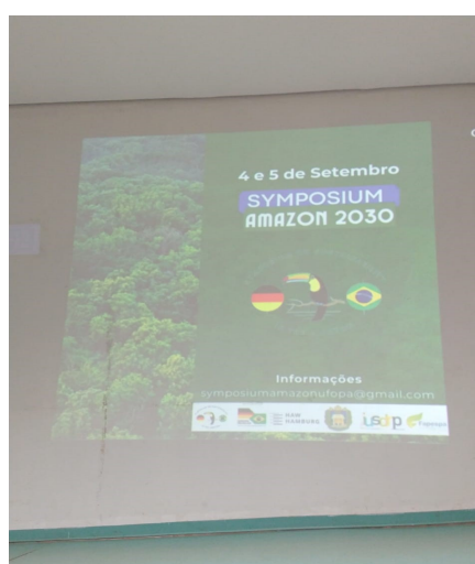
Figura 4. Apresentação do SYMPOSIUM AMAZON 2030.

Além destas ações, no ano de 2023 a UFOPA recebeu o 1º evento internacional como co-organizadora (figuras 3, 4 e 5). Nesse contexto, o simpósio "AMAZON 2030-SUSTAINABILITY ISSUES IN THE WORLD'S LARGEST RAINFORESTS REGION" foi organizado pela Inter-University Sustainable Development Programme (IUSDRP), o International Climate Change Information and Research Programme (ICCIRP), a Hamburg University of Applied Sciences (Alemanha), a Manchester Metropolitan University (Reino Unido) e a Universidade Federal do Oeste do Pará (UFOPA), com 2 dias (04 e 05 de setembro) de palestras e apresentações que contaram com a participação de pesquisadores da Alemanha, Portugal, China, Austrália e Estados Unidos, além de pesquisadores de instituições nacionais, como da UNIR, UFAM, UFV, UEMA e UFPA.