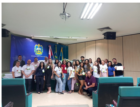
Figura 6. Equipe de organização do SYMPOSIUM AMAZON 2030.