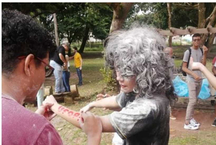
Foto: Divulgação do listão dos Aprovados no PSR Ufopa 2023 (Fonte:Acervo Comunicação)

Destaca-se também o retorno de realização da Mobilidade Acadêmica Interna (Mobin), processo paralisado devido ao período de pandemia (Tabela 4). Regido pelo edital N° 86/2023-CPPS/UFOPA o edital ofertou 544 vagas, sendo 414 para discentes ingressantes pelos Processos Seletivos Regulares (PSR), 65 vagas para discentes ingressantes pelo Processo Seletivo Especial Indígena (PSEI) e 65 vagas para discentes ingressantes pelo Processo Seletivo Especial Quilombola (PSEQ), ou seja, houve uma oferta diferenciada com critérios também diferenciados para alunos indígenas e quilombolas, previstos em edital.