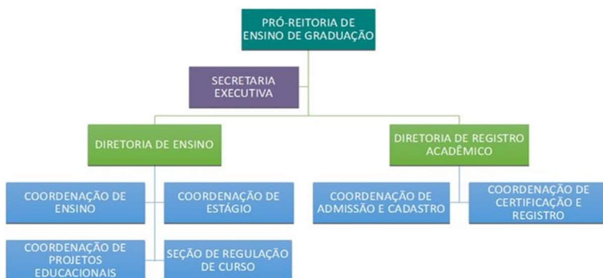
Figura 1 - Organograma da Proen.