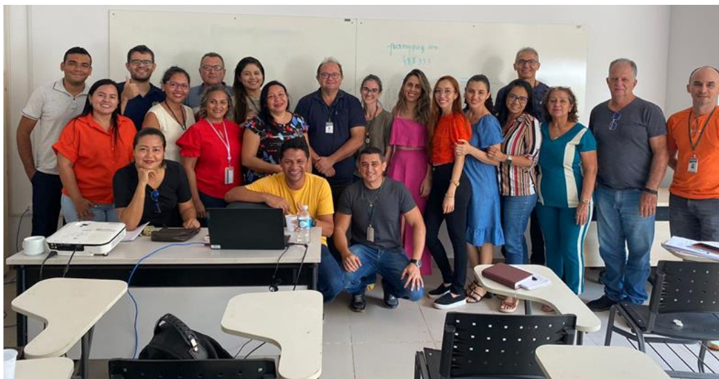
Fotos: Curso sobre Gestão Acadêmica no Ensino Superior

Qualificação dos Cursos de Graduação da Ufopa, que selecionou 10 cursos de Graduação para receberem recursos para implantação de planos de trabalhos visando ações de melhoria dos cursos.