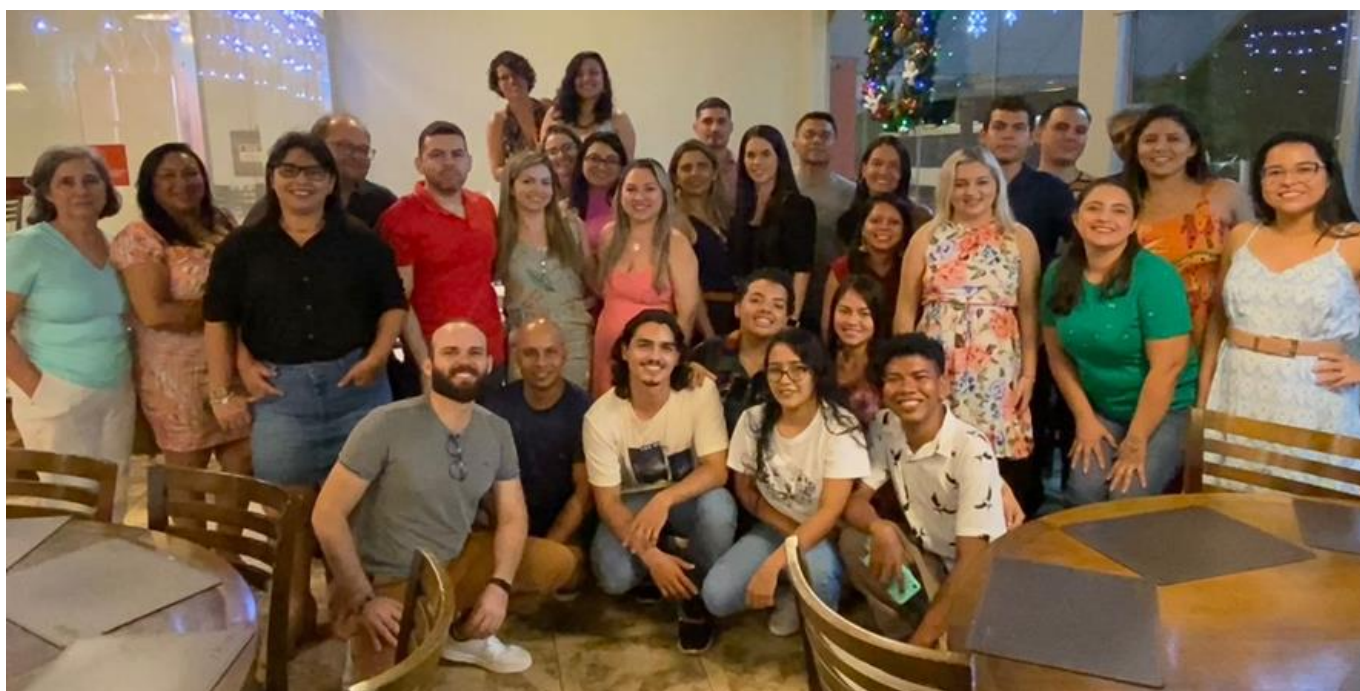
Servidores da Pró-reitoria de Ensino de Graduação

Com a perspectiva de construção de um novo Plano de Desenvolvimento Institucional (PDI 2024-2031) a partir de 2024, queremos contribuir para o planejamento a médio e longo prazo de nossas ações, bem como qualificar cada vez mais a oferta de nossos serviços, para que ele possa ser ampliado, diversificado, primando pela manutenção da educação pública, democrática e de qualidade.