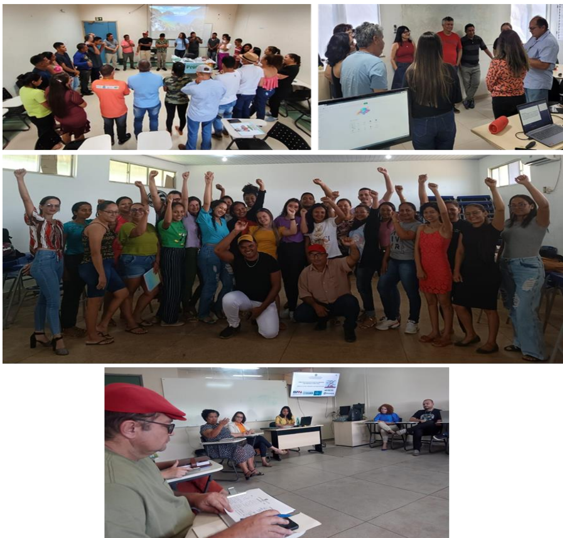
Fotos: À esquerda, calouros do Pronera/BESA fazem mística de acolhimento. Ao centro, calouros BESA/Pronera; acima formação pedagógica para docentes do Pronera/BESA

Importante ressaltar a continuidade da parceria com o governo do estado do Pará através Secretaria de Estado de Ciência, Tecnologia e Educação Profissional e Tecnológica (Sectet) para a oferta já iniciadas em 2023 de seis turmas de graduação, nos municípios Faro (Licenciatura Integrada em Matemática e Física), Uruará (Licenciatura em Biologia), Oriximiná (Licenciatura em Geografia), Trairão (Licenciatura em Pedagogia), Mojuí dos Campos (Bacharelado em Engenharia Florestal) e Juruti (Bacharelado em Engenharia Civil), e três turmas a serem iniciadas em janeiro de 2024 (alunos já habilitados), Direito em Almeirim e Novo Progresso e Administração em Oriximiná. Pelo Programa Nacional de Formação de Professores da Educação Básica (Parfor) a Ufopa passou a ofertar uma turma de Licenciatura em Geografia, no município de Almeirim.