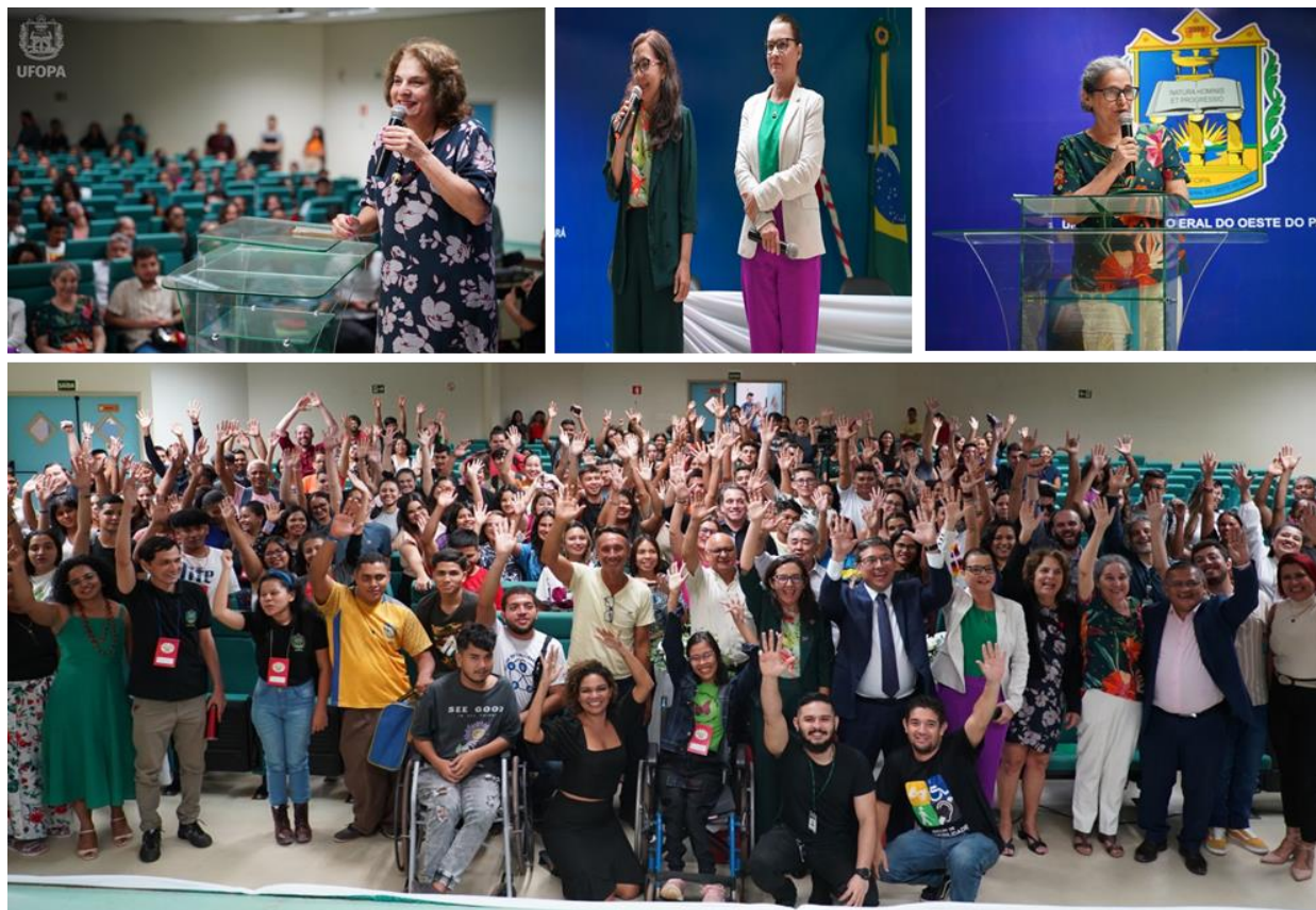
Fotos: Acima, I Seminário de Interculturalidade da Ufopa (Fonte:Acervo Proen)