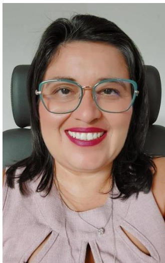
Pró-reitora de Pesquisa, Pós-graduação e Inovação Tecnológica Portaria nº 109, de 24 de março de 2023 - Gabinete da Reitoria – Ufopa