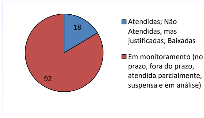
Gráfico 2 – Quantidade de recomendações atendidas no período de janeiro a abril e em monitoramento no exercício 2024